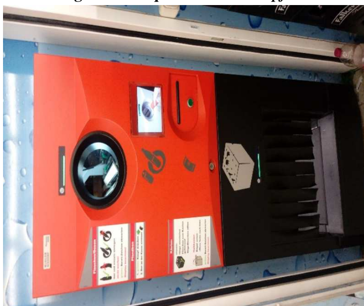
Figura 1. Máquina del sistema pfand

Dentro de los materiales de las prácticas se destacaron los objetos y equipos relacionados con la separación de residuos y el sistema pfand . Pfand es un sistema donde los alemanes que compran latas o botellas de bebidas pagan una pequeña cantidad extra por el producto y reciben esa cantidad cuando devuelven la lata o botella al supermercado o en cualquier punto que tenga la máquina para devolución (fig. 1). Se ayuda así a la economía circular, además de evitar la generación de residuos.