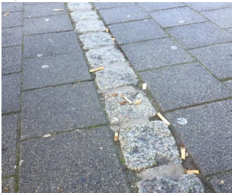
Figura 2. Colillas de cigarrillos frente a una universidad

Otro punto importante acerca del descarte de residuos observados en las notas de campo fue la eliminación de los residuos de cigarrillos. Los jóvenes, en su mayor parte, no están preocupados por este residuo, como se puede ver en la fig. 2.