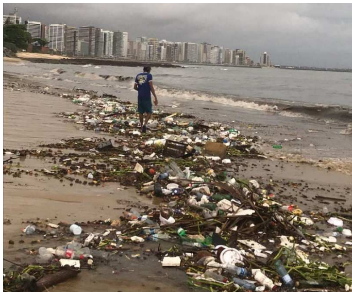
Figura 3. Borde de Fortaleza después de la lluvia

Es de destacar que las entrevistas en Fortaleza se realizaron durante la época de lluvias en la región. La gente estaba viendo las consecuencias de la eliminación incorrecta de desechos, como inundaciones e inundaciones en algunas partes de la ciudad. La basura desechada incorrectamente fluye junta y termina en la playa (fig 3).