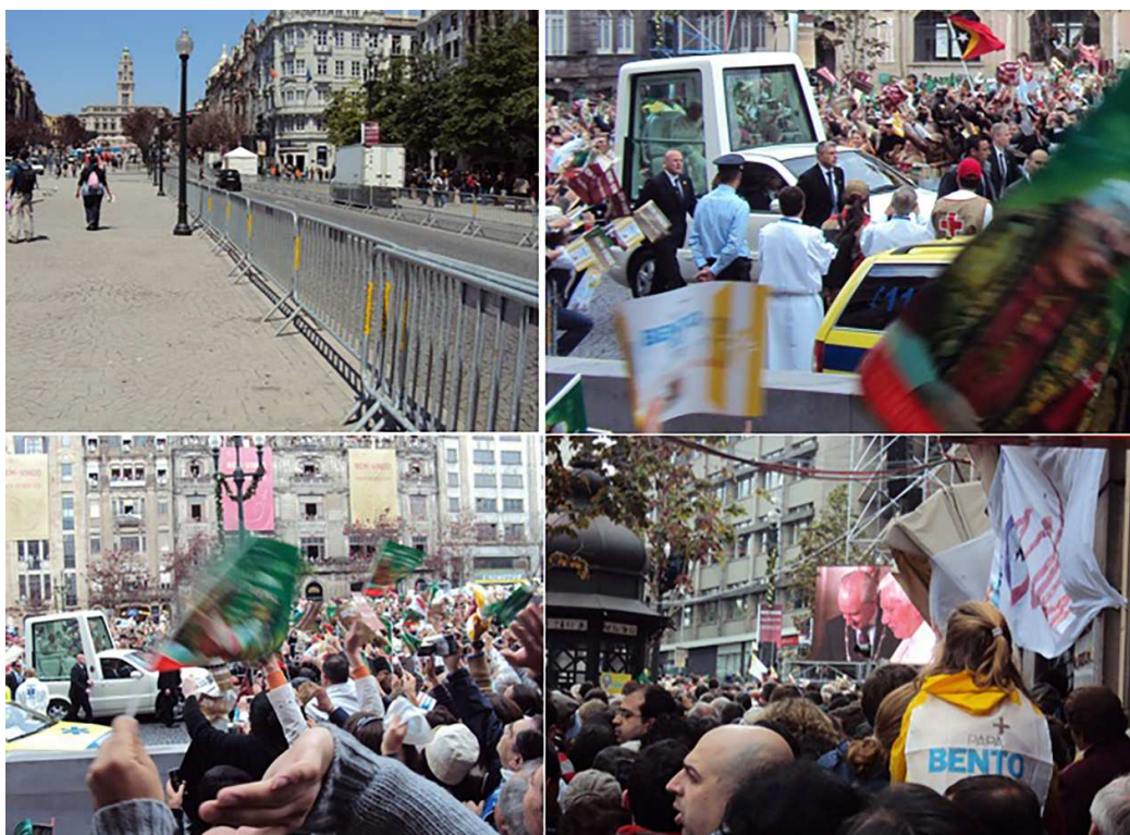
Figura 2. La visita del Papa Benedicto XVI a la Avenida de los Aliados

De izquierda a derecha y de arriba a abajo: 1. Colocación de barreras a lo largo de la Avenida de los Aliados; 2. La llegada del Papa Benedicto XVI a la Avenida de los Aliados; 3. El entusiasmo de los fieles; 4. El Papa Benedicto XVI recibido en el Ayuntamiento por el alcalde Rui Rio, transmitido en la Avenida de los Aliados en pantallas gigantes.