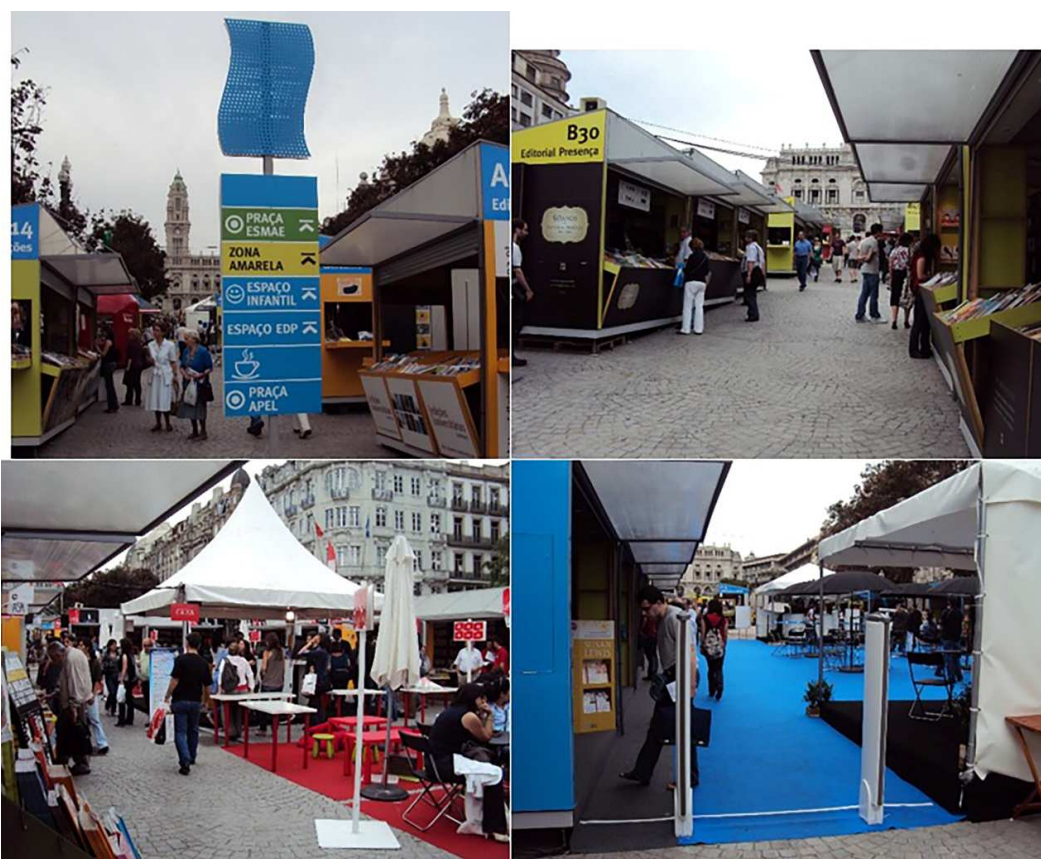
Figura 4. La Feria del Libro en la Avenida de los Aliados

De izquierda a derecha y de arriba a abajo: 1. Señalización de la Feria del Libro; 2. Librerías y quioscos editoriales; 3. Plaza del Grupo Editorial Leya; 4. Sensores de robo en una de las entradas de la Feria del Libro.