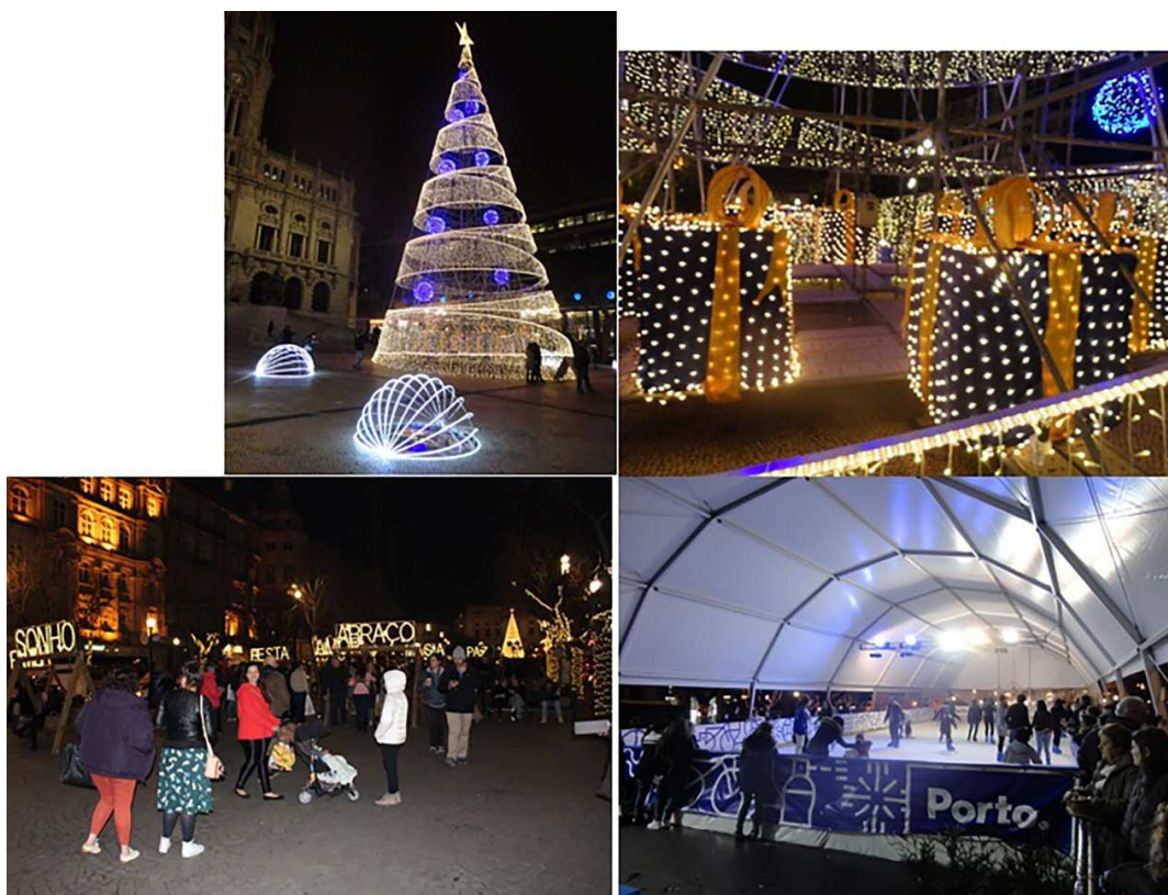
Figura 5. La Navidad en la Avenida de los Aliados

De izquierda a derecha y de arriba a abajo: 1. Árbol de Navidad (2015); 2. Regalos de Navidad (2015); 3. Los columpios y mensajes navideños (2017); 4. Pista de patinaje en la Avenida de los Aliados (2017).